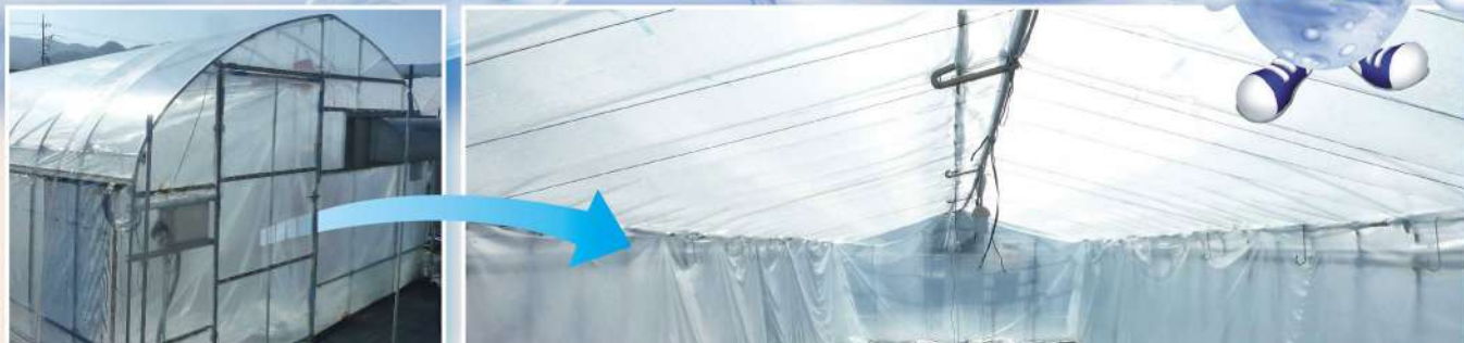
※「内張りサイド」としての使用例