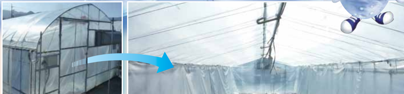
※「内張りサイド」としての使用例